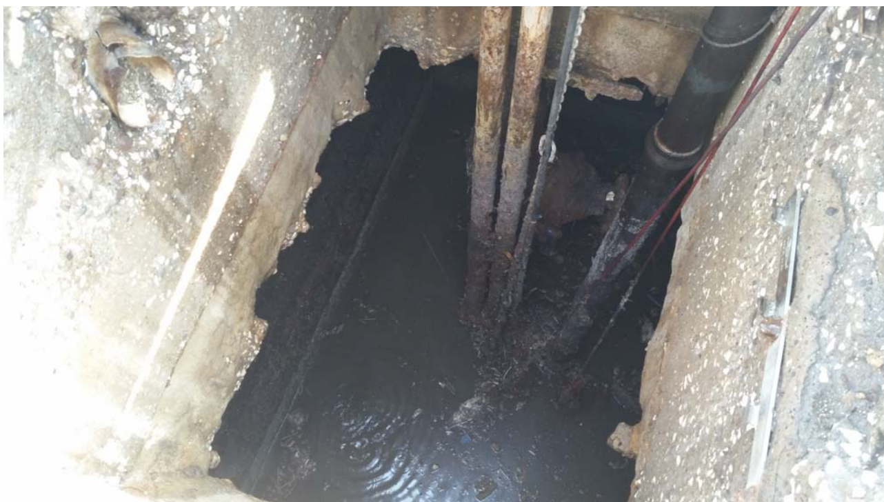
Fotografia 02 – Vasca alloggiamento elettropompe