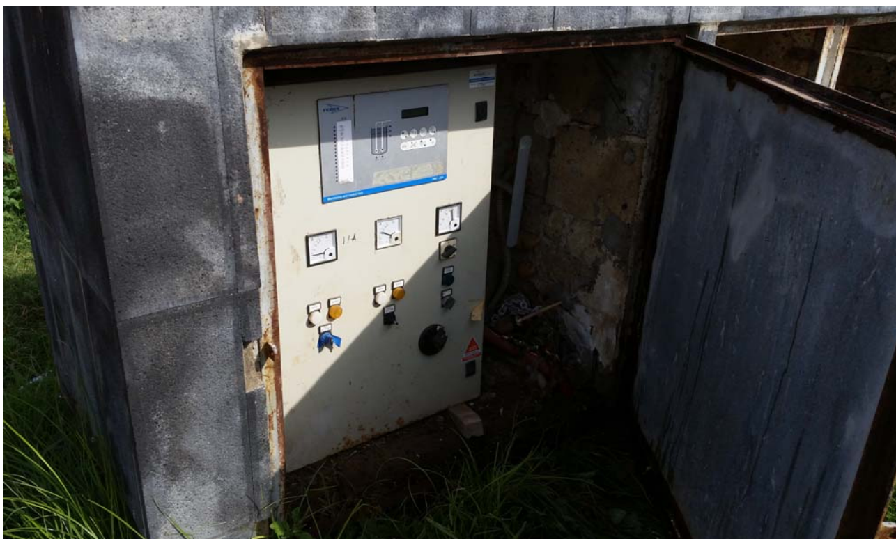
Fotografia 04 – Quadri elettrici