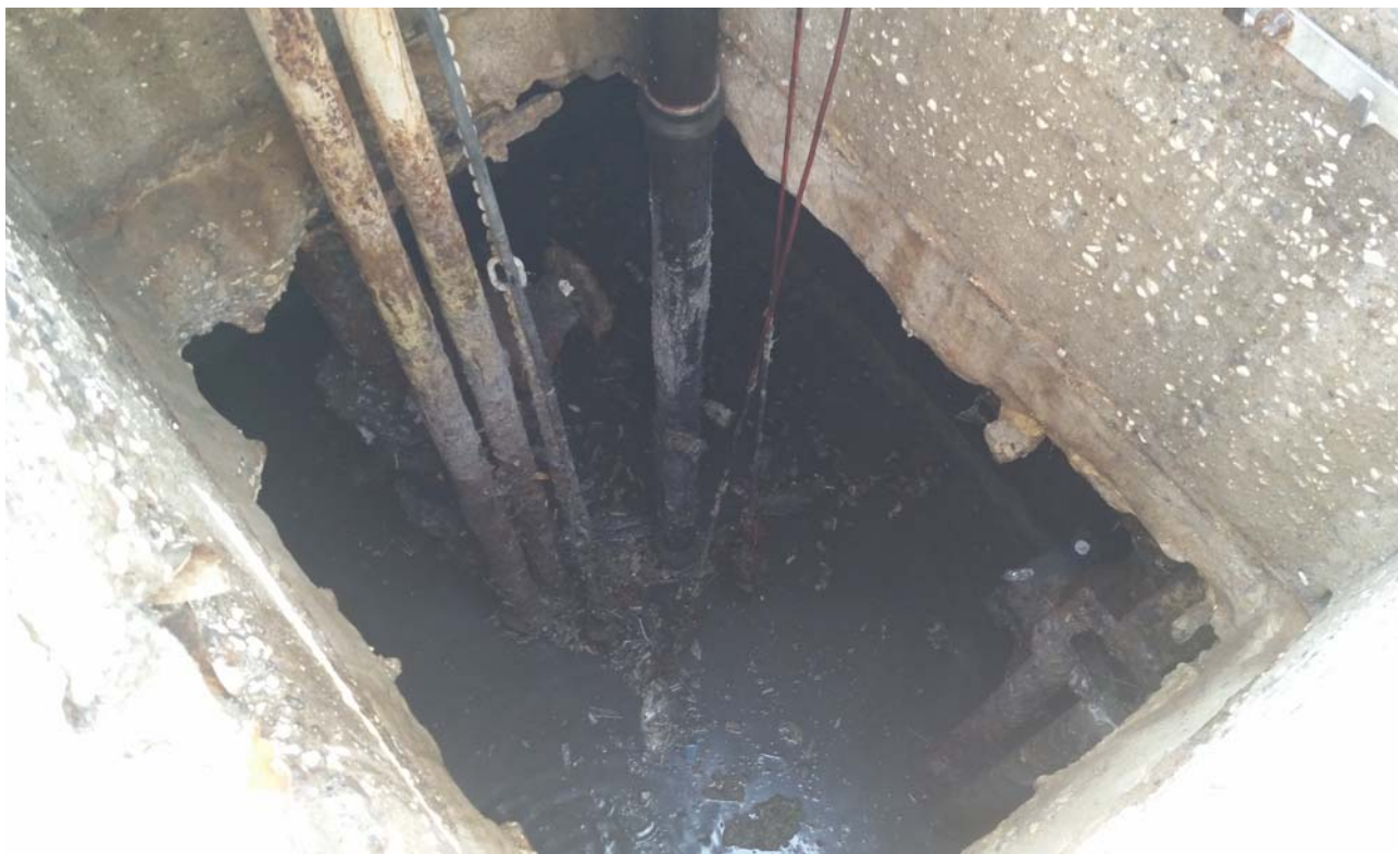
Fotografia 03 – Vasca alloggiamento elettropompe