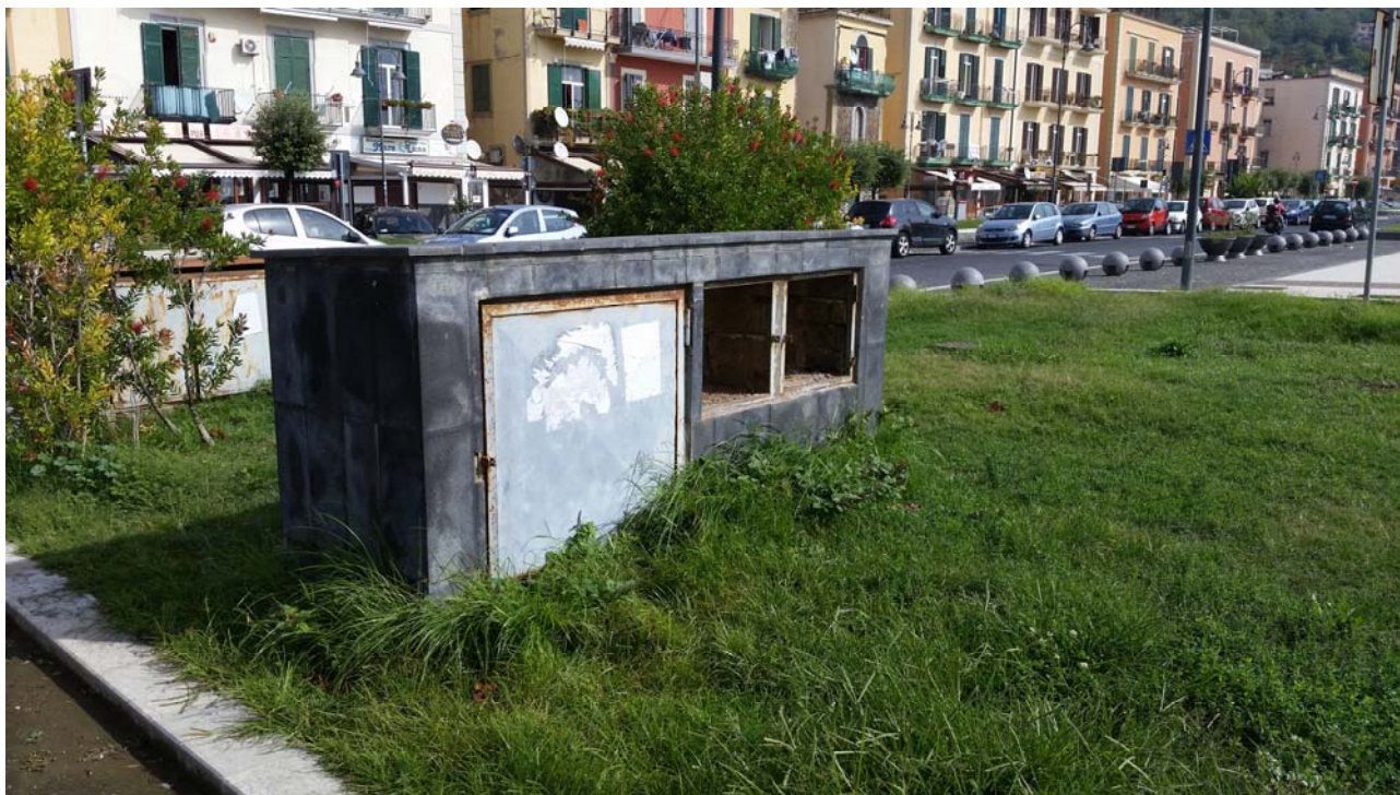
Fotografia 01 – Vista esterna

Nel presente paragrafo si riportano alcune fotografie relative all'impianto nei punti più significativi dell'impianto di sollevamento di Lungomare S. Pertini – Via Barletta .